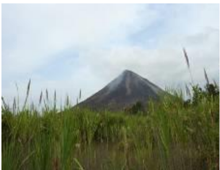
Vue sur le volcan Arenal du PN Arenal

Dîner et nuit à l'hôtel TABACON THERMAL RESORT & SPA