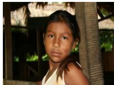
Jeune fille Bribí