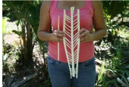
Enveloppe d'un cœur de palmier.