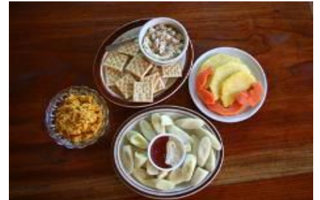
Préparations culinaires à base de cœurs palmiers.