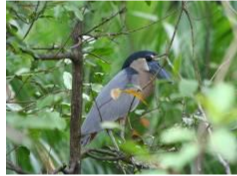
Pico Cuchara – Boat-biller Heron