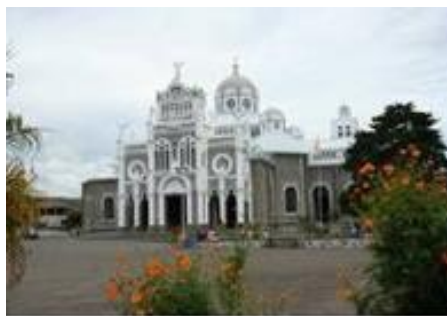
Basilique de Cartago