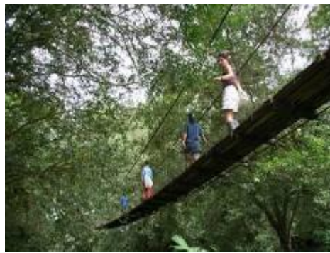
Pont suspendu au-dessus d'un rio...