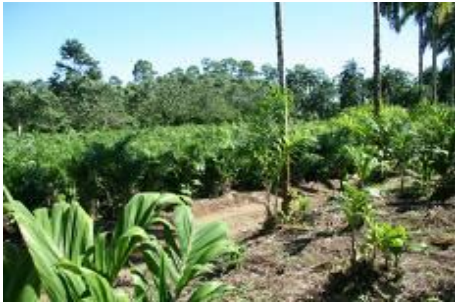
Plants de « palmito ».

Dîner et nuit à l'hôtel TABACON THERMAL RESORT & SPA