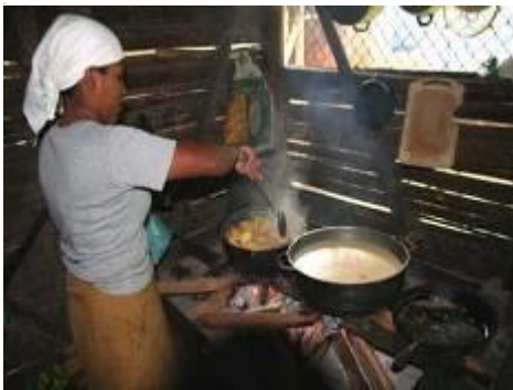
Préparation du déjeuner...