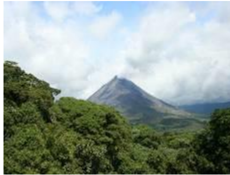
Vue sur Arenal...