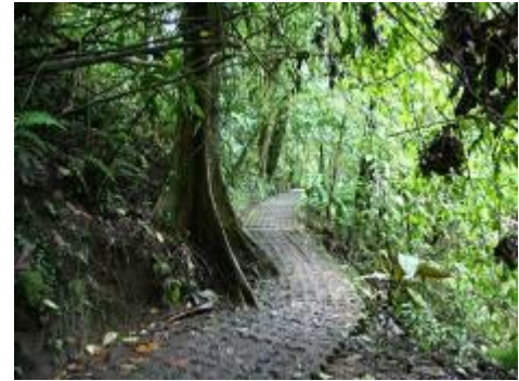
Un des sentiers...