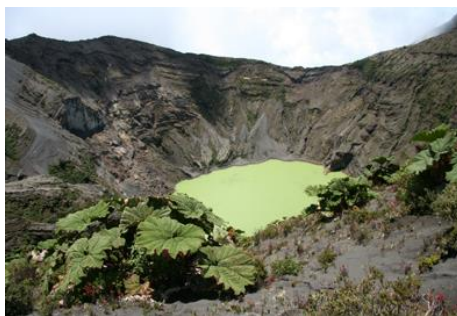
Cratère principal du volcan Irazú